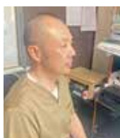
「当院では自費のPMTCシステムの 일환として本製品を使用したパウダーメンテナンスを組み込んでおり、患者さんからも好評です。」(森院長)

実際に臨床で使用してみると、ノズルが細いので臼歯部頬側へのアプローチが容易で、舌側も十分に視野が確保できて非常に見やすいため、術者への負担が少ないと感じました。また、口腔内の状態に合わせてパワー調整やパウダー流量調整ができるので、短時間で歯面がツルツルになるのもありがたいですね。