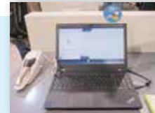
「プライムスキャンコネク」は、ノートパソコンとスキャナーのみのシンプルな製品構成。