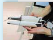
「トリオス4」と「トリオス5」を比較。ハイスベックかつスリム化されたボディ。