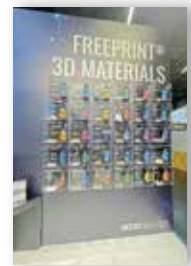
DETAX社の3Dプリンター用マテリアル。模型用、テンポラリー用、スプリント・アライナー用、デンチャー用、クラウン用など、30種類ものラインナップを展示。