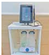
デュアルセレクトディスペンサーには、500mLボトルを2本装着できる。

また、「デュアルセレクトディスペンサー」(給水ボトルユニット)も設置しているので、患者さんの口腔内の状態に合わせて薬液を使ったスケーリングも可能となり、これまで以上に質の高いメンテナンスを提供できています。(間宮院長)