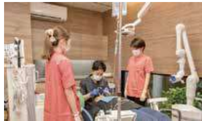
一般歯科医院で行う日帰り全身麻酔風景

る麻酔方法です。以前であれば、病院で入院しなければ全身麻酔は受けられませんでした。しかし、この20年の間に全身麻酔に使用する薬剤は大きく進歩し、術後の覚醒や回復に掛かる時間が大幅に短縮できるようになったことから、安全に日帰り全身麻酔を受けられるようになってきました。