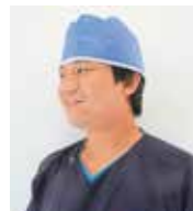
「根管治療の負担が軽減され、患者さんに喜んでいただけるのが嬉しいですね。」(杉原先生)

高齢化がすすんでいる昨今、狭窄根管などの難しい症例の増加が予想されます。こうした症例では根管拡大に時間がかかる、ファイルが破折するなどの心配がありますが、「トライオートZX2」を使うことで安全で確実な根管治療が可能です。また、歯牙の寿命を延ばすことができるため、患者さんにより多くのメリットを提供できるようになります。これからもこうした機器を活用し、患者さんに最良の医療を提供していきたいと思っています。