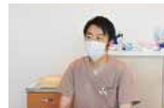
「REファイルONEは、追随性がよくて使いやすいのでおすすめです。」(土田院長)

歯科治療の技術は日々進歩しているため、これからも良いと思った製品は積極的に取り入れ、地域の患者さんの口腔環境の維持に真摯に向き合っていきたいと思っています。