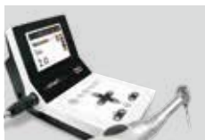
使用するシステムが一目で分かるフルカラー液晶ディスプレイ。回転数やトルクを確認しながら治療できるので安全性も高い。

NiTiファイルは「Wave one gold」をメインで使用しており、症例に応じて「プログライダー」や、「プロテーパー・ネクスト」なども使用します。「Wave one gold」はしなやかな素材でできているため、湾曲が強い場合でも破折しづらくて使い勝手が良いですね。1本だけで治療が完了することも多いため、患者さんの通院回数を減らせる点が一番のメリットだと思います。