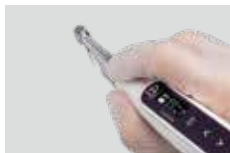
340°回転可能でさまざまな部位へのアクセスが容易なコントラアングル。

NiTiファイルは「デントクラフト REファイル ONE」を使用しています。反復運動によりシングルファイルテクニックでの根管拡大が可能なので、とてもシンプルに治療でき、術者にとっても患者さんにとっても、負担が軽減されていると感じます。